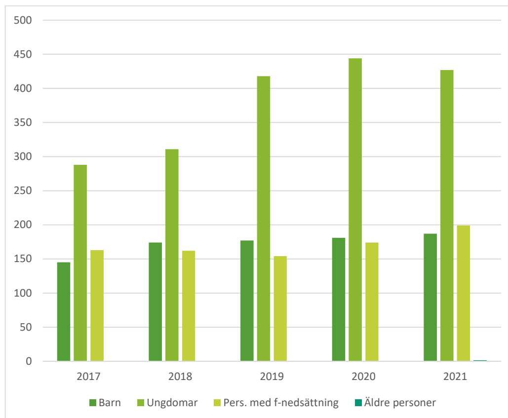
Diagram 2 – Beviljade medel per målgrupp 2017–2021 (mnkr)